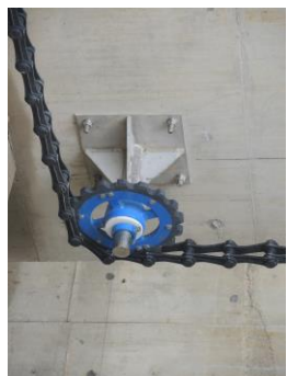
角軸鏈輪 (污泥坑處)