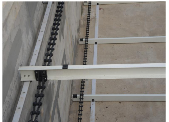
上方回程導板, 下方磨耗軌道