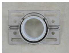
水中軸承及鏈條鬆緊調整