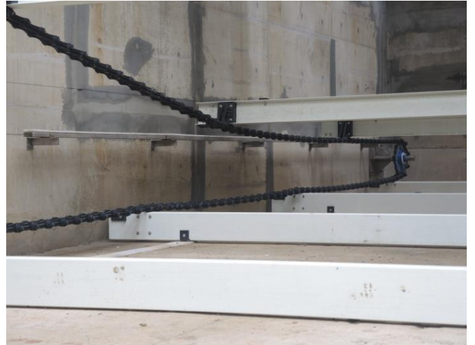
下部角軸鏈輪鏈條轉向