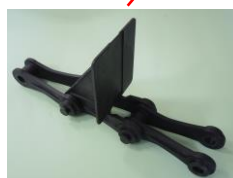
刮泥鏈條及固定鏈結