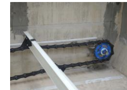
刮泥軸固定座(尾端處)