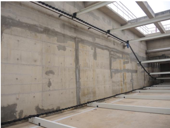
上部角軸鏈輪(惰輪)後鏈條重力自然下垂