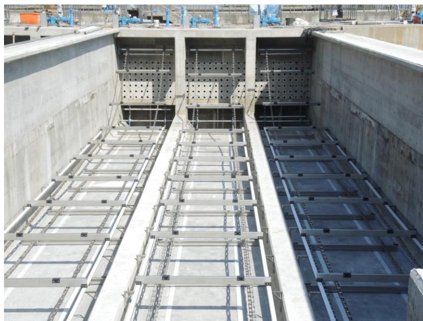
污泥坑(前端)鏈刮組裝