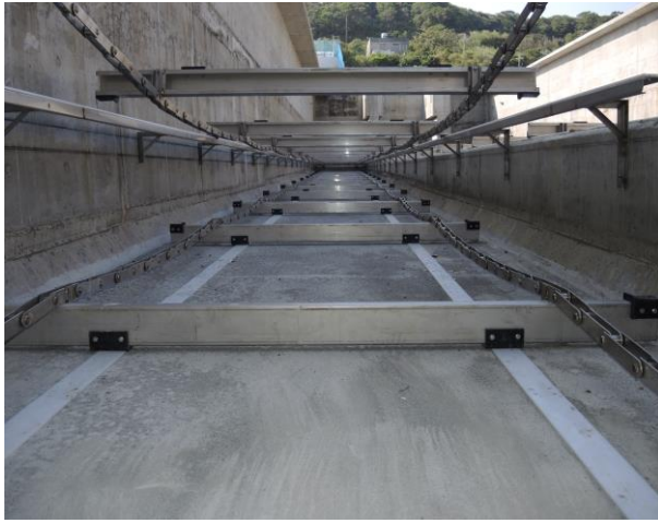
池底軌道、刮板及刮泥鏈條組裝