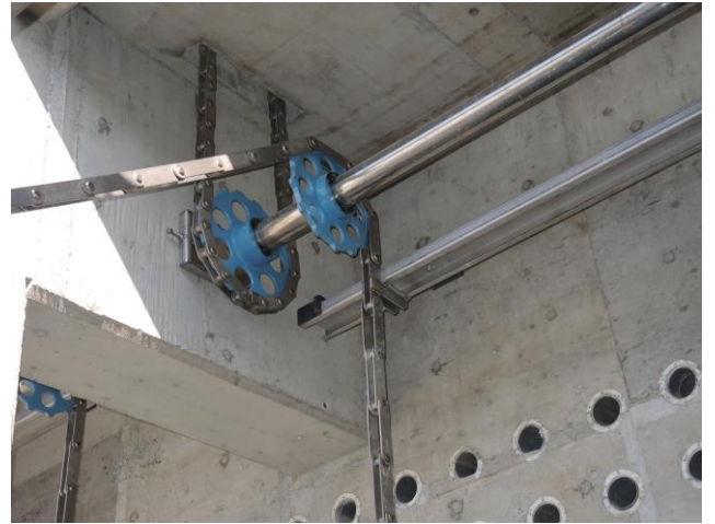
驅動鏈條與刮泥鏈條